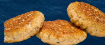
Kirjolohi-silakamurekepihvi 70 g