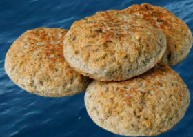
Muikkupihvi 40 g