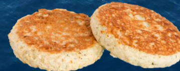
Haukimurekepihvi 70 g