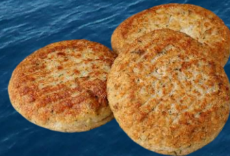
Särkipihvi ruisjauhotuksella 70 g