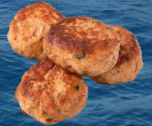
Kirjolohipyörykkä 20 g