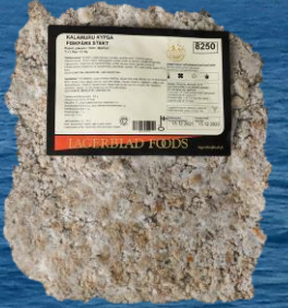
Kalamuru kypsä 1,5 kg

WWF:n Kalaopas ohjaa vastuulliseen kuluttamiseen liikennevaloin. WWF:n Kalaoppaassa tarjolla olevia ruokakaloja on luokiteltu vihreälle, keltaiselle tai punaiselle listalle. Lagerblad Foodsin käyttämät kalat silakkaa lukuun ottamatta saavat vihreää valoa! Meidän tukkuvalikoimassa on tarjolla 11 erilaista kalatuotetta ja kaikki kalatuotteemme paitsi Haukimurekepihvi ovat saaneet Hyvää Suomesta -merkin.