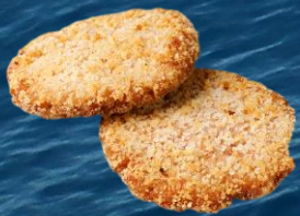
Paneroitu kirjolohimurekeleike 70 g