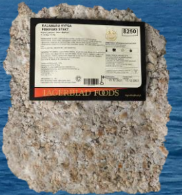
Fiskfärs stekt 1,5 kg

Många fiskbestånd mår dåligt och överfisket är ett stort hot. WWF Fiskguiden hjälper att välja miljövänliga och hållbara sjömatprodukter som kommer från hållbart förvaltade fisken eller från ansvarfulla miljöanpassade vattenbruk. WWF fiskguide tar upp flera olika hållbarhetsparametrar som är viktiga för att göra En bedömning av hur hållbart ett fiske, eller en fiskodling är. Fisk får efter utvärdering sedan grönt, gult eller rött ljus – som trafikljusen. Alla fiskarter vi använder i våra produkter förutom strömming får grönt ljus! Vi har 11 olika fiskprodukter i vårt grossist-sortiment och alla förutom Gäddfärsbiffen har fått Gott från Finland -märket.