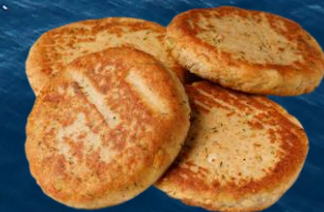
Fiskbiff av regnbågslax 65 g