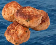
Regnbågslaxbulle 20 g