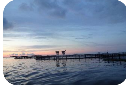
Merikasvatuksen alueet, toimintamallit ja teknologiat