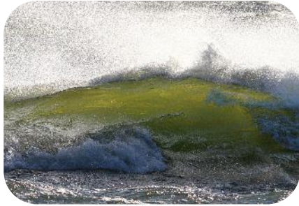
Ympäristövaikutusten arviointi ja säätely