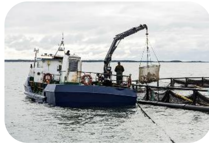
Poikastuotannon ja emokalastojen hallinta