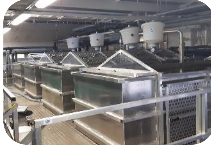
Ominaiskuormitus ja hiilijalanjälki